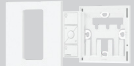
Controles de pared