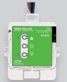
Controles de carga inalámbricos